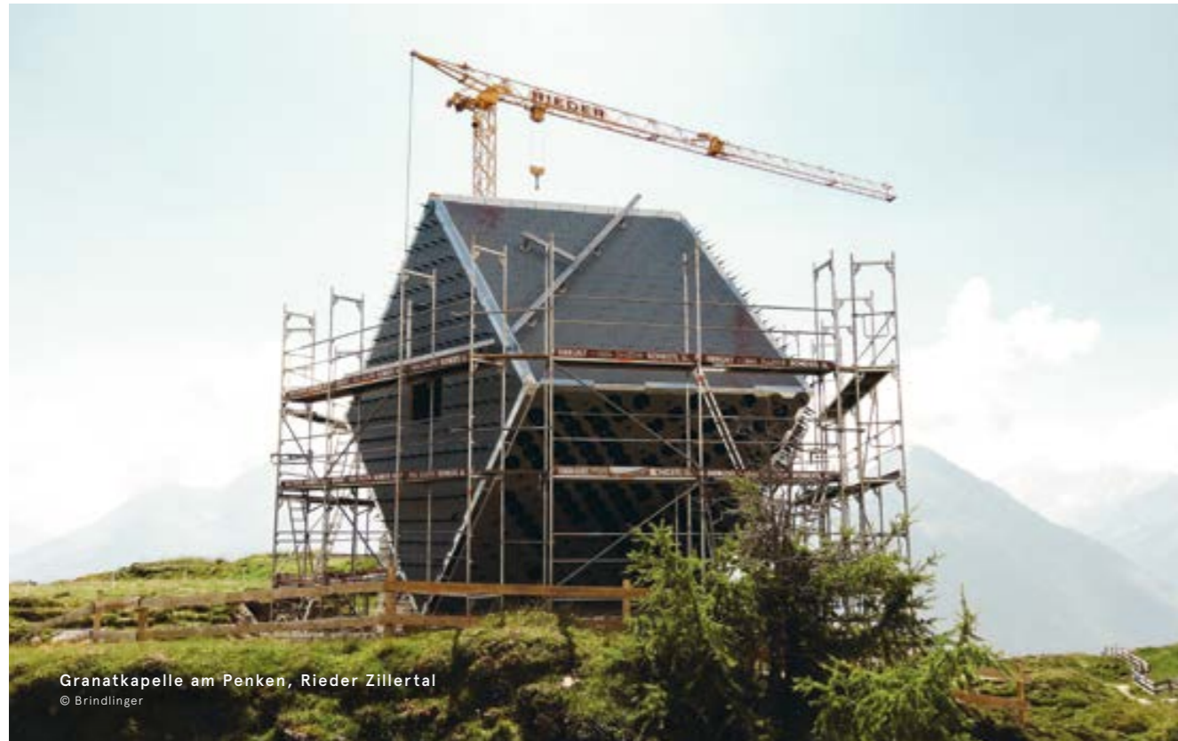
Granatkapelle am Penken, Rieder Zillertal