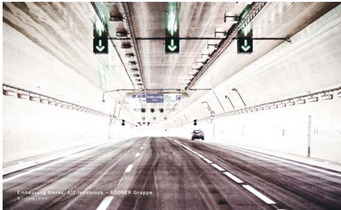
Einhausung Amras, A12 Innsbruck – BODNER Gruppe