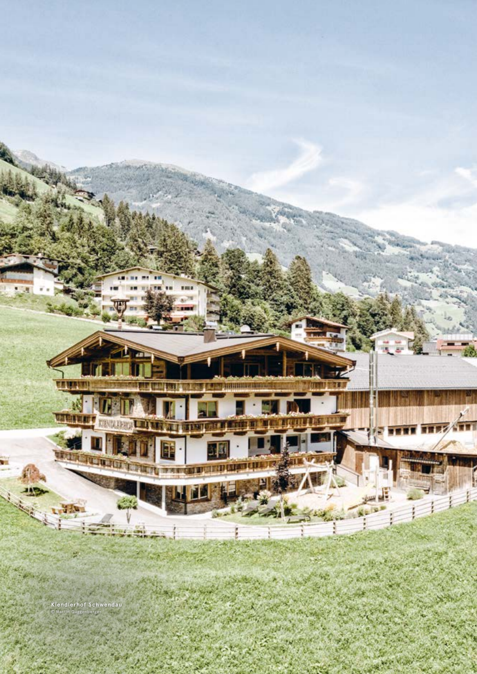
Kiendlerhof Schwendau © Martin Guggenberger