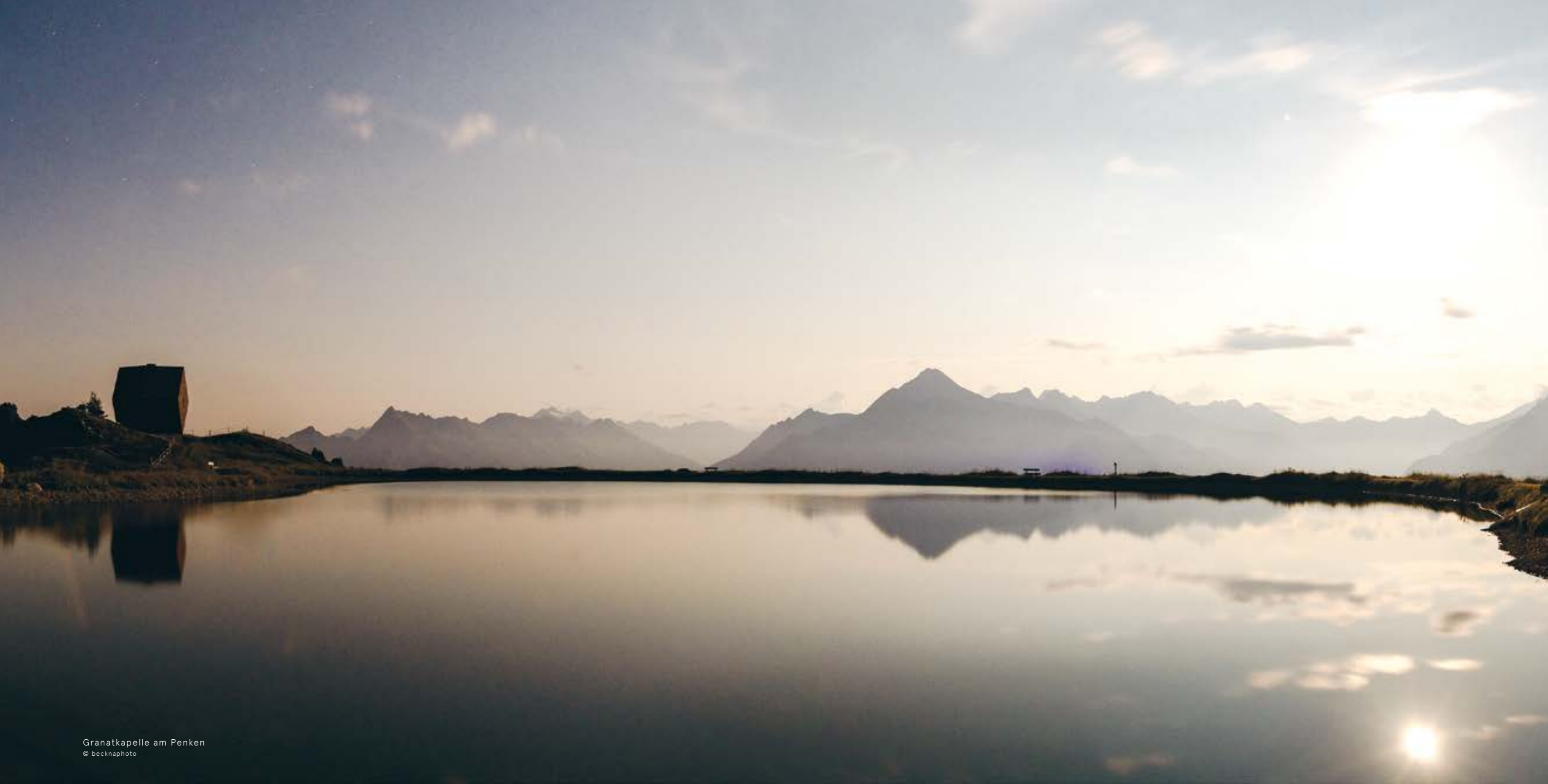
Granatkapelle am Penken