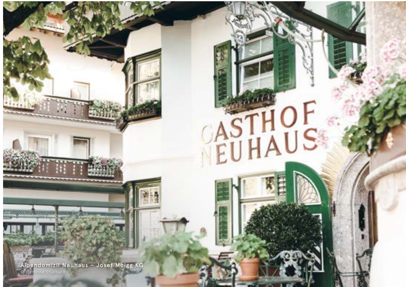
Alpendomizil Neuhaus – Josef Moigg KG