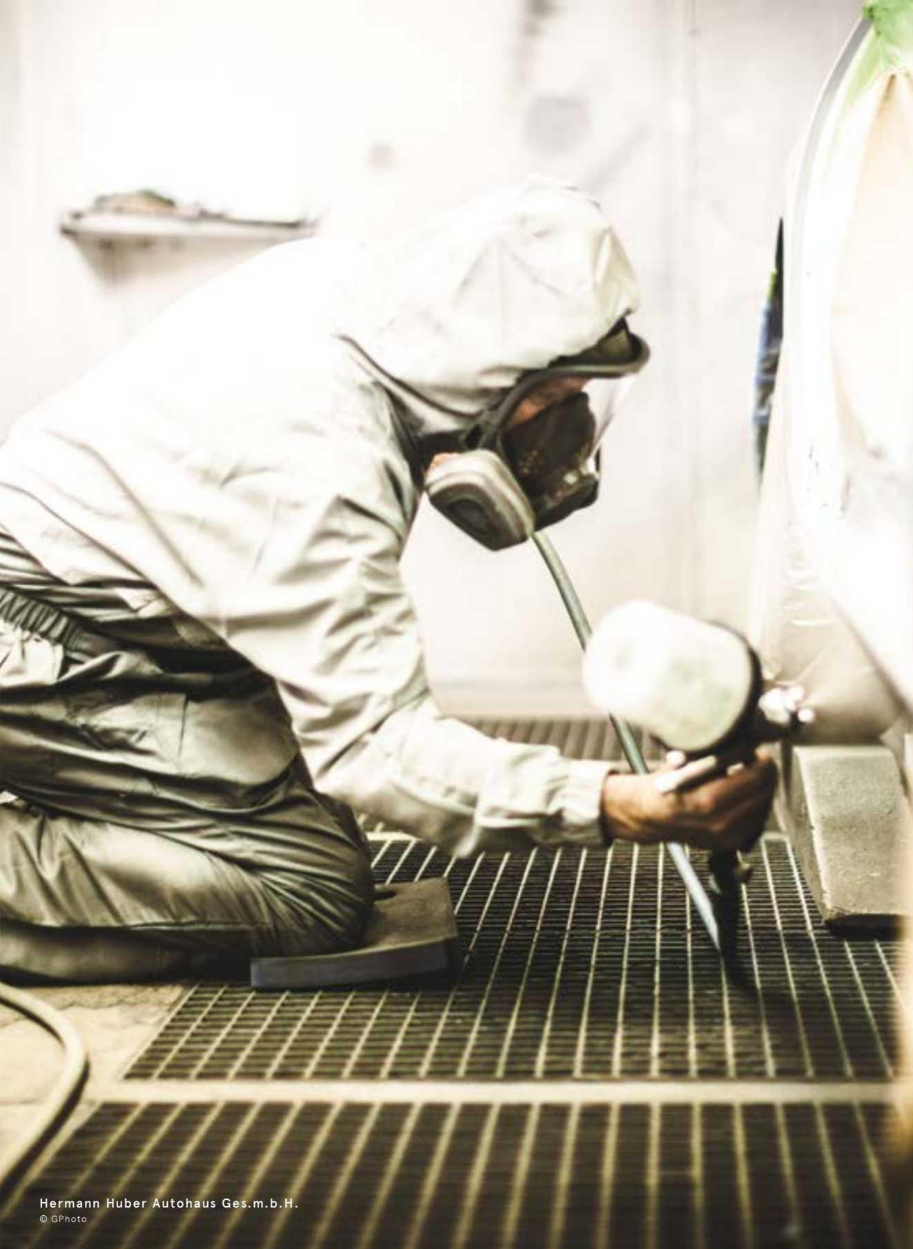
Hermann Huber Autohaus Ges.m.b.H.