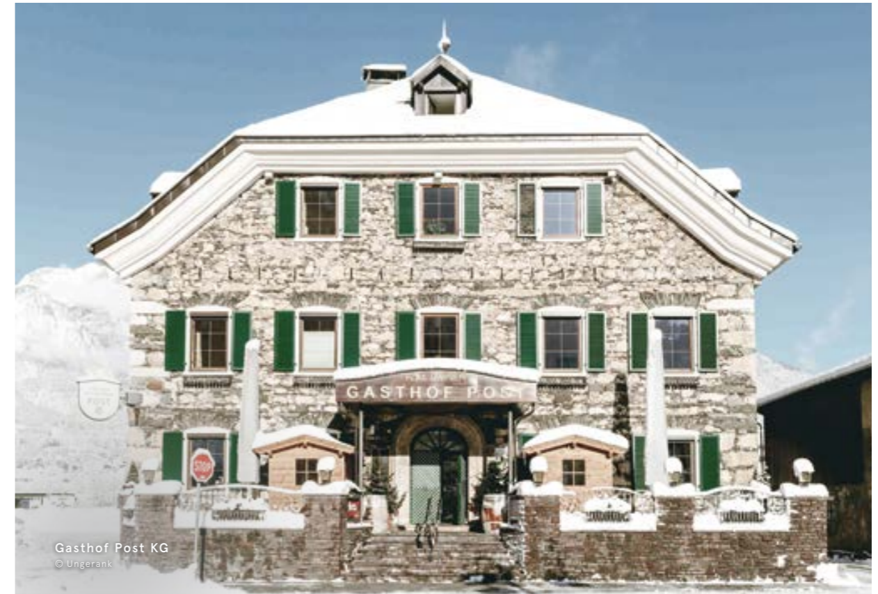
Gasthof Post KG