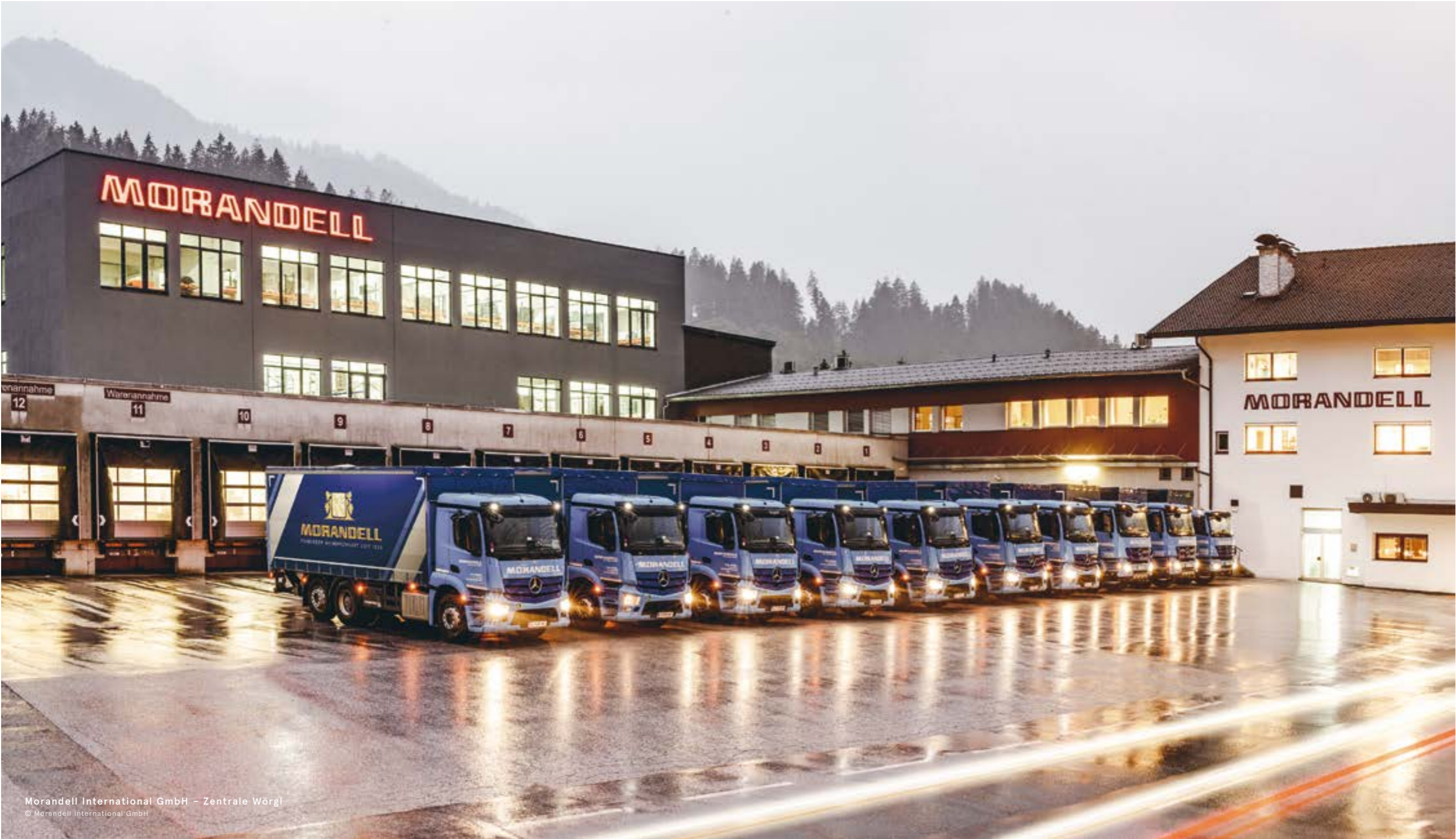
Morandell International GmbH – Zentrale Wörgl