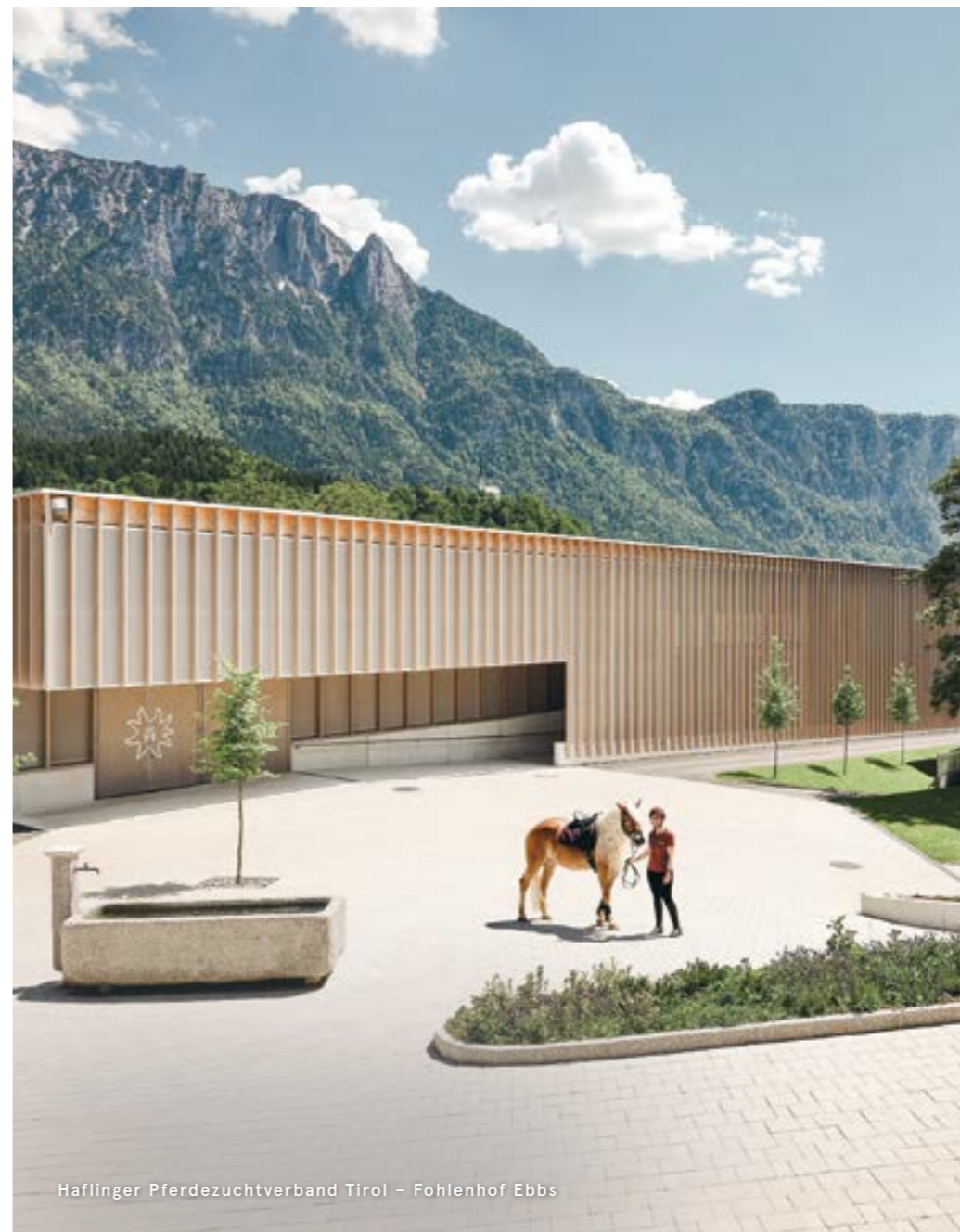
Haflinger Pferdezuchtverband Tirol – Fohlenhof Ebbs