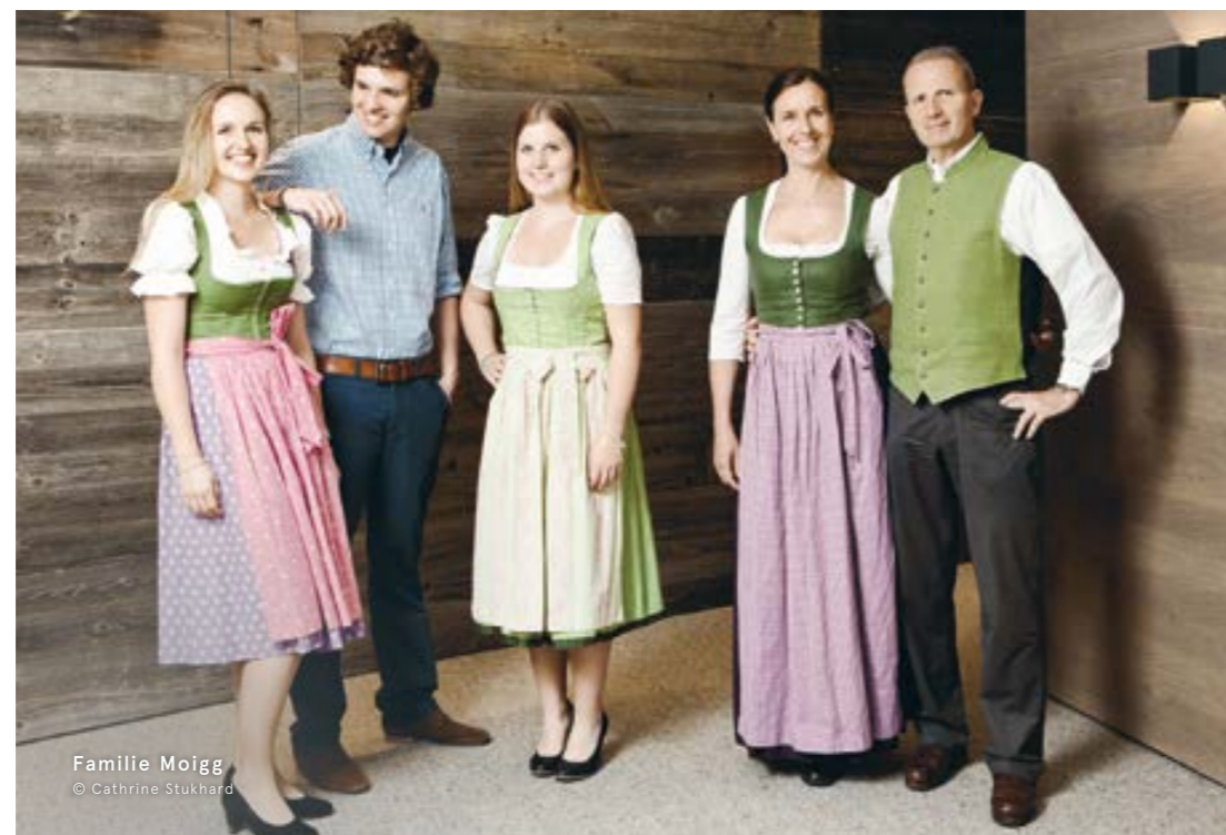
Familie Moigg