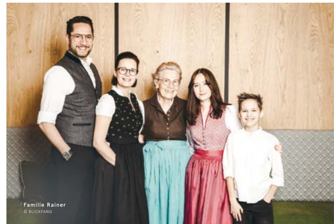
Familie Rainer